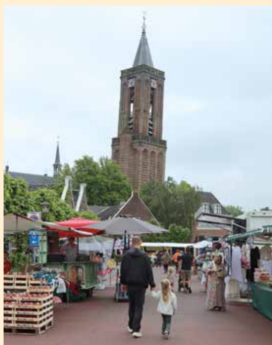
Jaarmarkt mei 2024

Tentoonstelling 'De Stem van het Volk' www.rhcvechtenvenen.nl