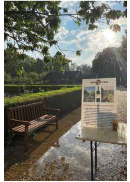
Na regen komt zonneshijn

De landgoedwinkel is vanaf juni elke maandagochtend open van 10.00 – 12.00 uur. De ingang is via het zijhek, dat open staat als